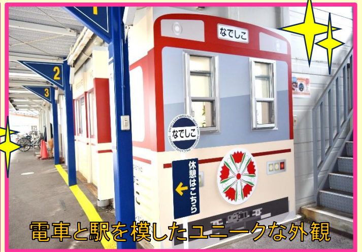
電車と駅を模したユニークな外観