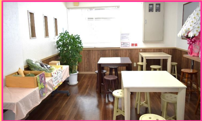
パンや野菜の販売コーナー